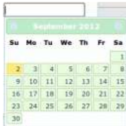
Gambar 18. Data Tanggal