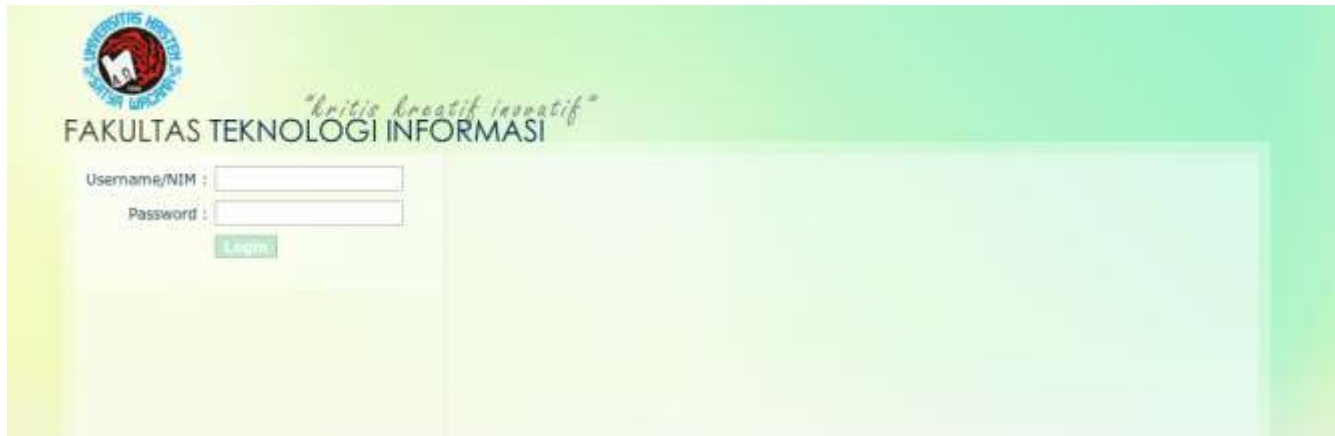
Gambar 1. Halaman Login.

Tampilan awal dari Sistem Informasi Alumni FTI UKSW seperti pada Gambar 1 yang digunakan oleh administrator maupun alumni untuk melakukan login menggunakan username (administrator) dan NIM (alumni) dilengkapi dengan password masing-masing. Dengan kondisi seperti saat instalasi awal, halaman ini dapat diakses pada alamat http://fti.uksw.edu/alumni/ atau http://ftiuksw.org/alumni